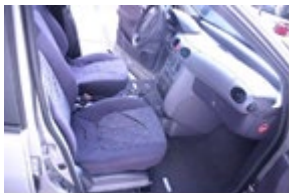
Scheuren en krassen in bekleding