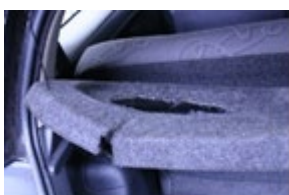
Montage gaten na demontage van accessoires